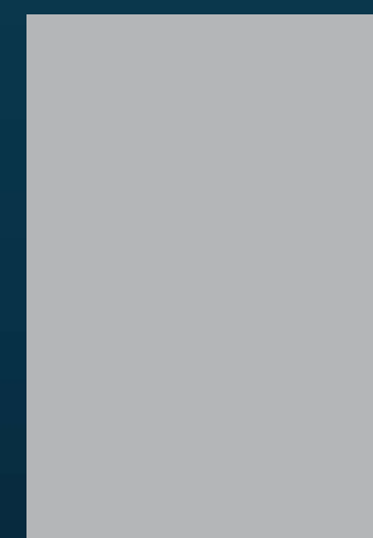
Aún tendría que pensarlo