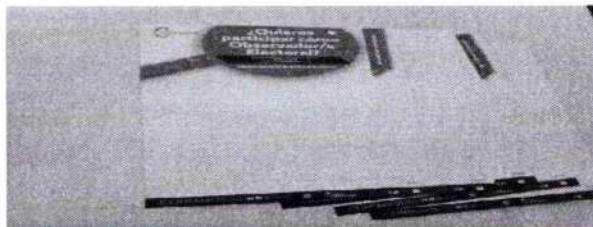
Convocatoria de Observación en sistema Braille

Entre el 7 y 8 de diciembre de 2023 la Dirección Ejecutiva de Organización Electoral y Geoestadística entregó a esta Dirección Distrital 30 dos ejemplares de la Convocatoria de Observación en sistema Braille para ser colocada en la sede distrital como se muestra a continuación: