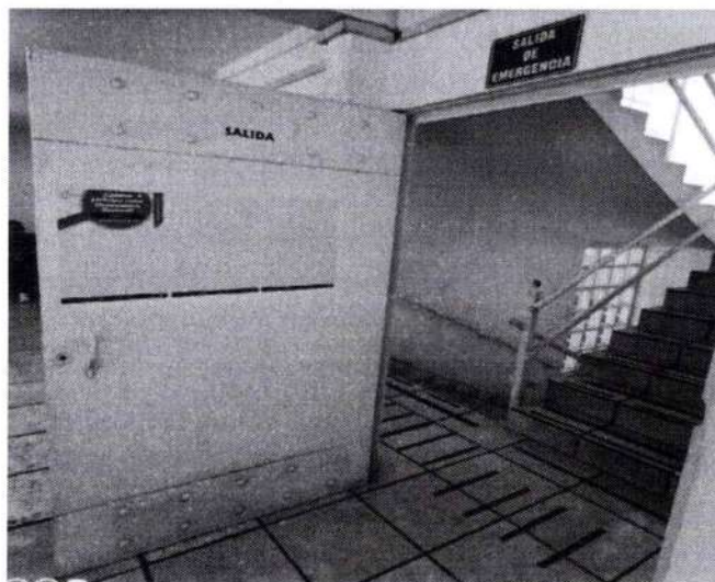
Convocatoria de Observación en sistema Braille, colocada en la puerta de ingreso a la Sala del Consejo Distrital