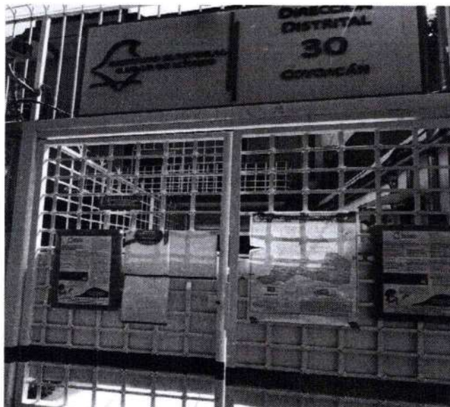
Convocatoria de Observación en sistema Braille, colocada en la puerta principal de la sede distrital