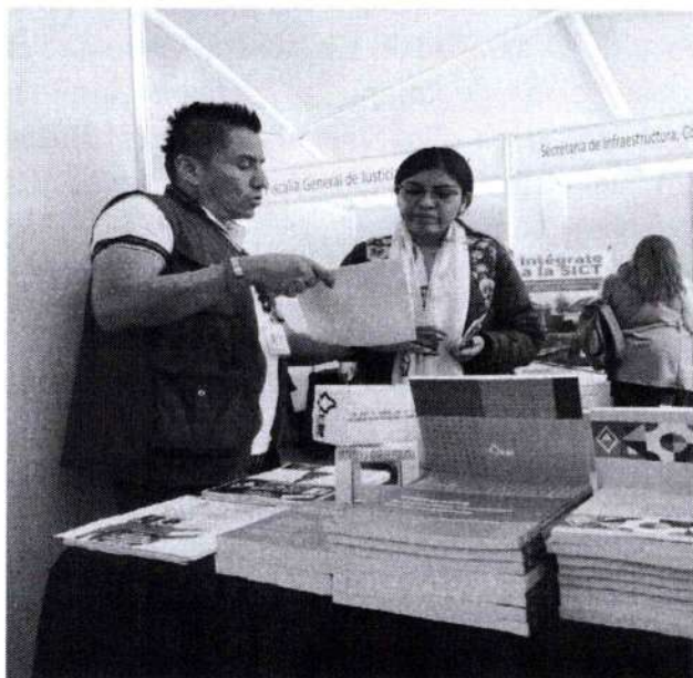
Personal adscrito a la Dirección Distrital 30 proporcionando información sobre la Convocatoria de Observador/a Electoral