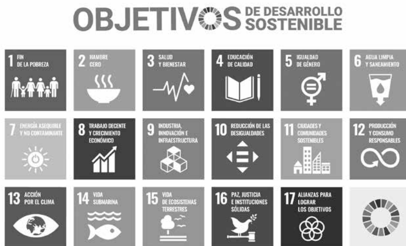
Cuadro 2. Los 17 Objetivos de Desarrollo Sostenible

Estos objetivos fueron alineados en cinco esferas de importancia crítica para la humanidad y el planeta, mejor conocidas como las 5P's (por sus nombres en inglés: people, planet, prosperity, peace, partnership ), a saber: