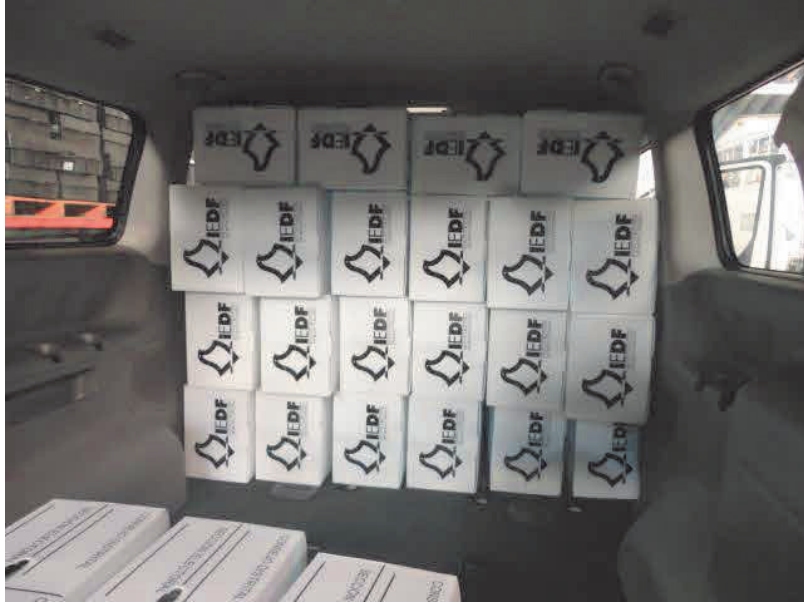
2° FILA DE CAJAS= 22