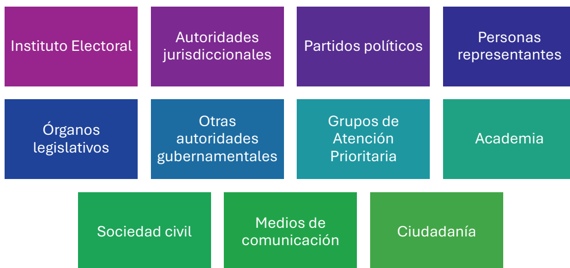
Figura 1 Instancias interesadas en acciones afirmativas

Asimismo, constituyen un referente para los GAP, la academia, la sociedad civil, los medios de comunicación y la ciudadanía en general interesada en el fortalecimiento de la participación y representación política incluyente.