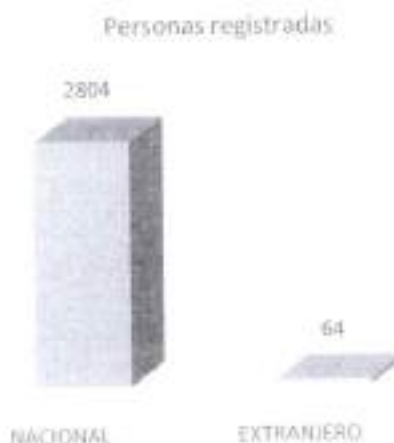
Gráfica 6. Procedencia de la solicitud