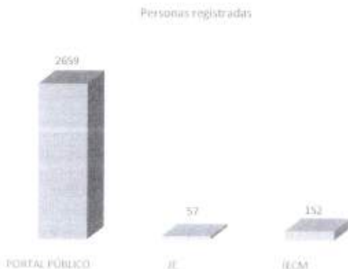
Gráfica 1. Personas registradas para acreditarse como observadoras electorales portal INE