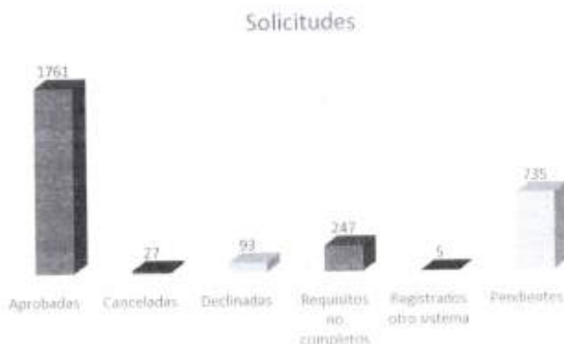
Gráfica 2. Estatus de las solicitudes

Fuente: https://observadores.ine.mx/ , corte al 29 de mayo de 2024