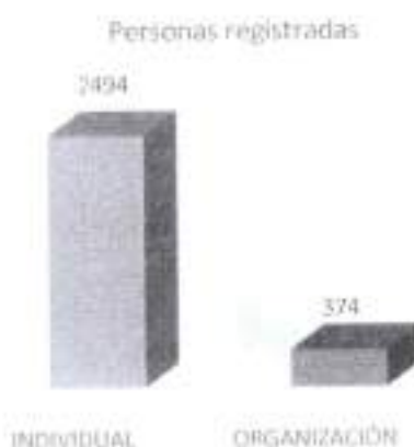
Gráfica 5. Tipos de solicitud