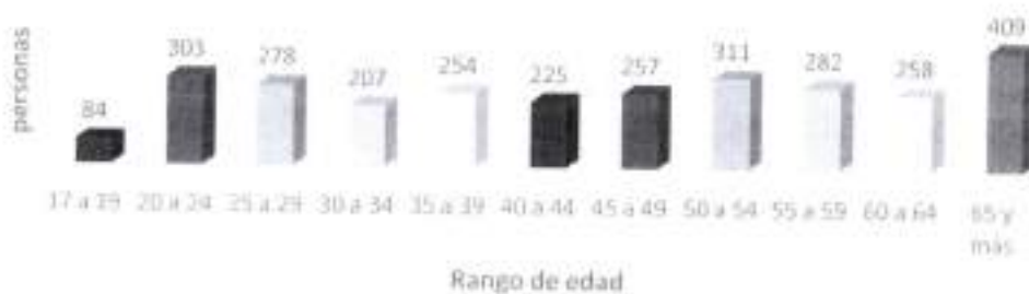
Gráfica por edad