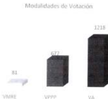
Gráfica 7. Interés en observar las modalidades de votación