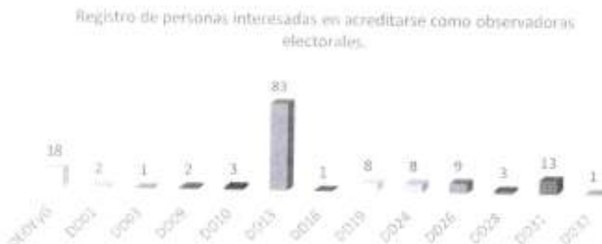
Gráfica 8. Personas registradas para acreditarse como observadoras electorales IECM