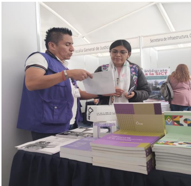
Personal adscrito a la Dirección Distrital 30 proporcionando información sobre la Convocatoria de Observador/a Electoral