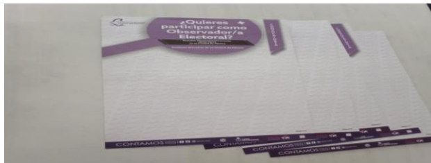
Convocatoria de Observación en sistema Braille

Entre el 7 y 8 de diciembre de 2023 la Dirección Ejecutiva de Organización Electoral y Geoestadística entregó a esta Dirección Distrital 30 dos ejemplares de la Convocatoria de Observación en sistema Braille para ser colocada en la sede distrital como se muestra a continuación: