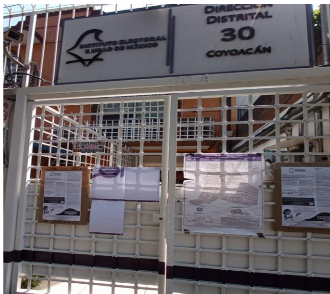
Convocatoria de Observación en sistema Braille, colocada en la puerta principal de la sede distrital