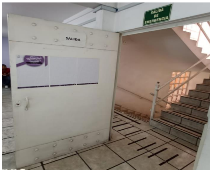
Convocatoria de Observación en sistema Braille, colocada en la puerta de ingreso a la Sala del Consejo Distrital