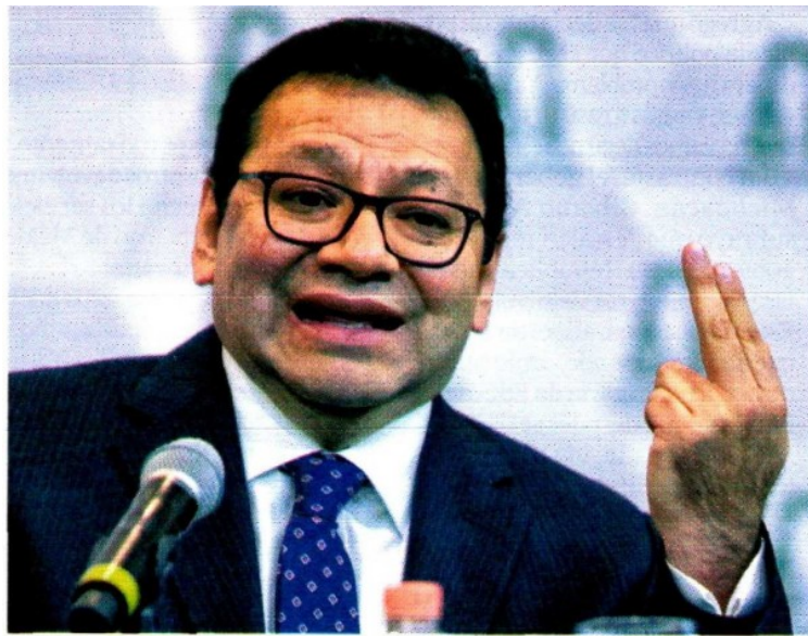
INICIO. Felipe Alfredo Fuentes Barrera, nuevo presidente del TEPJF.