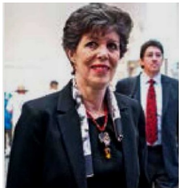
SALIDA. La magistrada justificó su salida por una “crisis” en el Tribunal.

● El Consejo de la Judicatura Federal (CJF) nombró a la ex titular de la Procuraduría General de la República (PGR), Arely Gómez González , como la nueva contralora del Poder Judicial de la Federación (PJF). Dicho nombramiento fue emitido por Arturo Zaldívar , presidente de la Suprema Corte de Justicia de la Nación (SCJN).