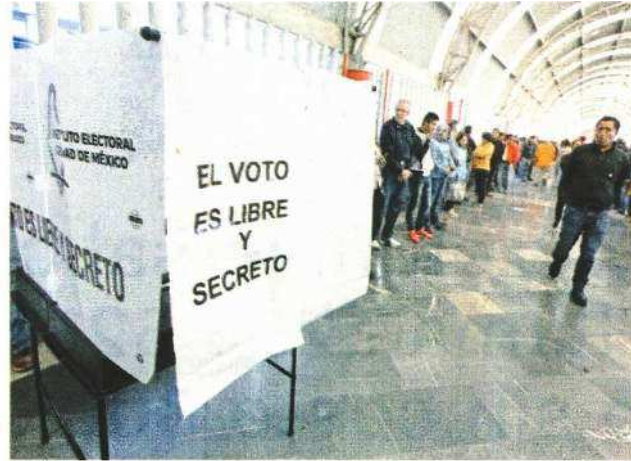
Además del voto en casillas, mexicanos en el exterior y en prisión preventiva podrán emitir su sufragio.