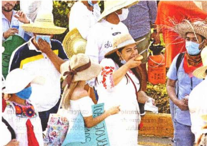
A los asistentes a la manifestación se les repartieron tortas que llevaron políticos y seguidores de Félix Salgado.