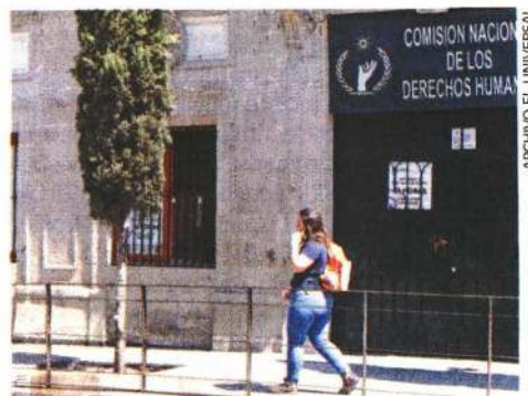
En el programa de blindaje participan la CNDH, la FEDE, el INE y el TEPJF.

Blindaje Electoral 2021 prevé, entre otras acciones, que desde el inicio de las campañas electorales y hasta la conclusión de la jornada se suspenda la propaganda gubernamental, con excepción de la información referente a servicios educativos y de salud o las necesarias para la protección civil en casos de emergencia. ●