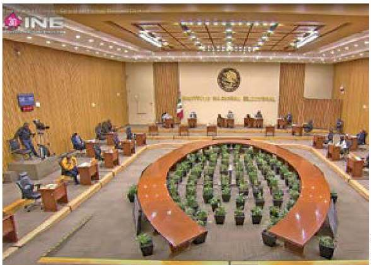
SESIÓN. Los consejeros avalaron el levantamiento de un muestreo y que el informe se presente en mayo próximo.