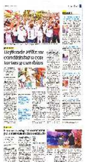
La marcha que encabezó Félix Salgado recorrió de la Diana al Zócalo, sobre la Costera Miguel Alemán. En su momento, el morenista se dijo confiado en que el Tribunal Electoral le devolverá la candidatura por el gobierno de Guerrero.