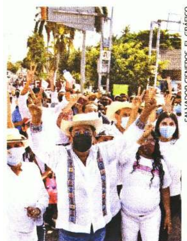
SALVADOR CISNEROS. EL GRÁFICO

CON MITIN, FÉLIX SALGADO MACEDONIO exigió que se le restituya la candidatura de Morena a la gubernatura de Guerrero, que le retiró el INSTITUTO NACIONAL ELECTORAL , por no haber presentado sus gastos de precampaña. Salgado Macedonio acusó al INE de HOSTIGARLO a través de la FISCALIZACIÓN , mientras el CANDIDATO DE "ENFRENTÉ" , el abanderado de la alianza entre PRI-PRD, MARIO MORENO ARCOS , afirmó, VIAJA EN AVIÓN Y COME EN RESTAURANTES DE LUJO.