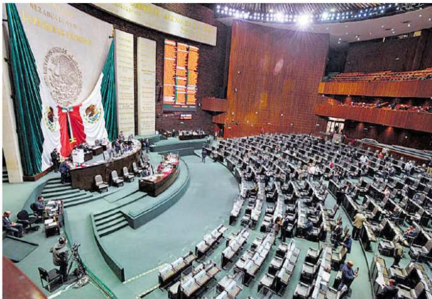
Migrantes buscan que partidos políticos los incluyan en sus listas de diputados plurinominales para la futura conformación de San Lázaro