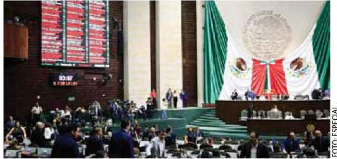
De la bancada de Morena son 101 diputados los que renunciaron a los apoyos.