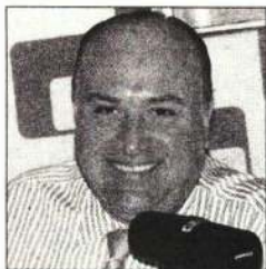
Por Víctor Sánchez Baños

-Delincuentes y famosos, a la Cámara -Como nunca, la política sin escrúpulo -Salgado y Morón, apuesta a una carta -Cruz Azul, pleito que nunca terminará