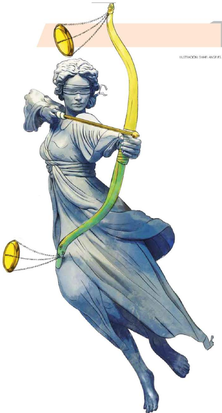
ILUSTRACIÓN: SMAEL ANGELIS.