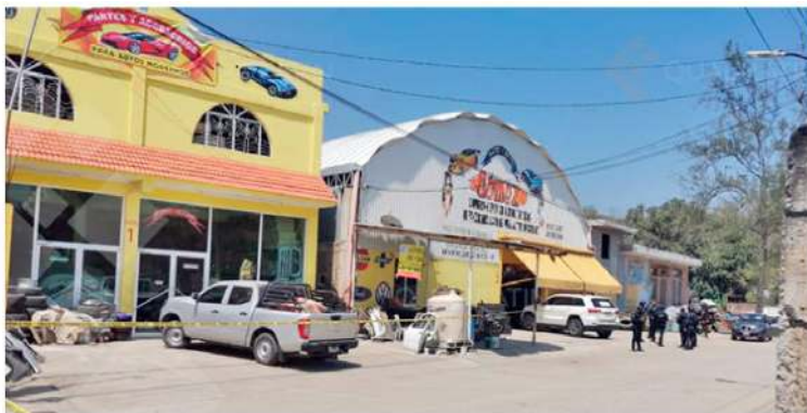
CONFUSIÓN. El aspirante del Sol Azteca se encontraba en su negocio de autopartes.