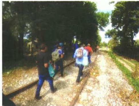
Los migrantes que viajan por su cuenta caminan 164 km por la selva Lacandona rumbo a Palenque.