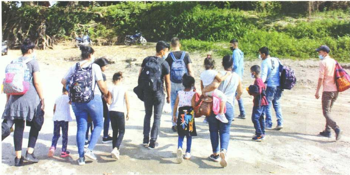
MARÍA DE JESÚS PETERS: EL UNIVERSAL

Chiapas. — Cientos de migrantes, entre ellos familias con niños, continúan cruzando de forma irregular a territorio mexicano por Frontera Corozal, en el municipio de Ocosingo, considerado territorio del EZLN, debido a que esta zona quedó exenta del operativo del Instituto Nacional de Migración y de fuerzas federales. | ESTADOS | A12