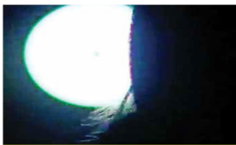
Olga (nombre ficticio) estuvo en la punta de lanza del equipo que capturó a la que es considerada operadora financiera del CJNG.

También se tejó la búsqueda hasta poder ubicarla en un edificio de 12 departamentos, localizado a 5.8 kilómetros de sitio de la ejecución de Ben Sutchi y Alon Azulay, quienes flanqueaban a La Güera en la mesa que compartían dentro de un restaurante de comida asiática en Plaza Artz, donde se habían citado para "hablar de negocios" el 24 de julio de 2019.