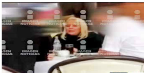
Días antes del atentado. La Güera se reunió con sus presuntas víctimas en otro restaurante del su de la Ciudad de México.

Luego se fue cerrando el círculo hasta crear un cerco mediante vigilancia presencial e inteligencia, con apoyo de sistemas de videovigilancia, para confirmar que se trataba de la acusada de ser la autora intelectual del doble homicidio.