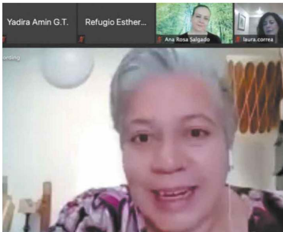
La Secretaría de la Mujer capacita a las candidatas al proceso electoral 2021 en temas referentes a la violencia política y los derechos humanos.