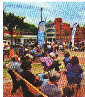
Puras promesas a vecinos

El 6 de junio, se conocerá con precisión que tan buen trabajo realizaron los alcaldes que buscan la reelección.