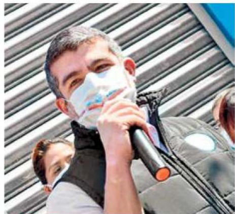
CANDIDATO. Mauricio Tabe, busca gobernar la Miguel Hidalgo.