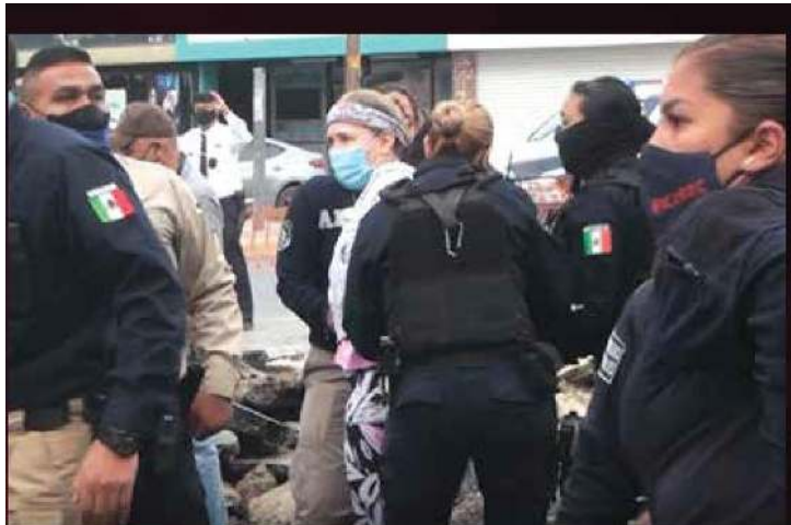
Policías estatales reprimieron una manifestación pacífica contra el BRT en Ciudad Juárez, Chihuahua.