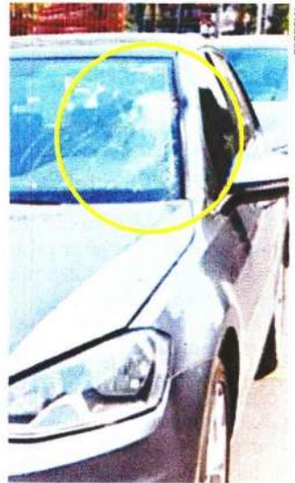
La policía revisó cámaras para dar con el vehículo implicado.