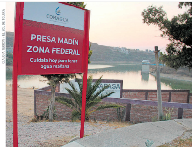
La extracción del agua excedente sólo se realizará por siete meses, de abril a octubre

La Peninsular es filial de Grupo Hermes, propiedad del empresario Carlos Hank Rhon. Ganó contratos en el gobierno de Enrique Peña Nieto para construir el primer tramo del tren México-Toluca, el diseño y construcción de la presa Zapoti-