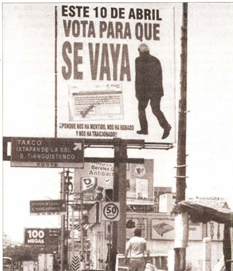
Crece la polarización de la consulta popular del 10 de abril.

Con el lema "No vamos a votar, terminas y te vas", poco más de una veintena de organizaciones llaman a la población a que acuda a distintos escenarios de la república para expresar su desacuerdo con la Revocación de Mandato, impulsada por el presidente López Obrador.