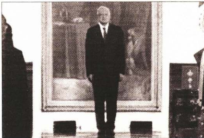
El presidente Andrés Manuel López Obrador.