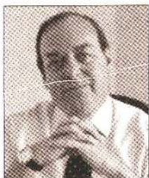
Por Ramón Zurita Sahagún

Los adversarios de la 4T se encuentran apurados para motivar a la ciudadanía para que no acudan a las urnas el próximo domingo 10 de abril.