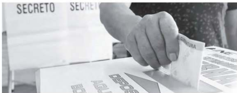
No habría presupuesto

Córdova Vianello indicó que el costo de revocación de mandato del próximo 10 de abril, será de mil 700 millones de pesos