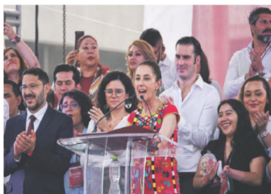
'SÍ A LA REFORMA'. Sheinbaum encabezó mitin en el Monumento a la Revolución.

Aseguró que gobiernos y firmas extranjeras están 'metiendo mano'. "Me consta que EU está haciendo lobby". Más tarde, el embajador de EU, Ken Salazar, asistió a Palacio Nacional. —D. Benítez / PÁGS. 28 Y 31