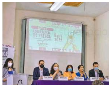
El Instituto Electoral de la Ciudad de México señala que los interesados podrán opinar del 21 al 28 de abril

Mencionó que el IECM es una institución de vanguardia que cuenta con mecanismos electrónicos de votación, los cuales se encuentran fuertemente blindados, "estamos hablando de un sistema que ha sido debidamente auditado en los pasados ejercicios consultivos de 2020 y 2021, por lo que contamos con las garantías suficientes para que la ciudadanía emita su voto de manera segura".