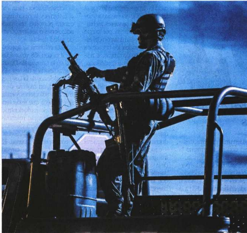
El Ejército Mexicano lanzó una licitación para comprar docenas de fusiles, ametralladoras y escopetas de apoyo aéreo y terrestre de alto poder.