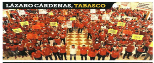
LÁZARO CÁRDENAS, TABASCO

Así se habrán basificado, a finales de 2022, 650 mil maestros, y se habrán regularizado 27 mil claves y reinstalado mil 57 profesores.