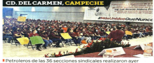
CD. DEL CARMEN, CAMPECHE

Petroleros de las 36 secciones sindicales realizaron ayer asambleas y acordaron paros en Pemex.