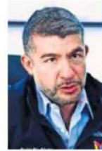
Mauricio Tabe Echartea

:::: Nos comentan que a inicios de esta semana, la Secretaría de Desarrollo Económico informó que durante el primer trimestre de 2023 se crearon 44 mil 558 empleos en la Ciudad de México, con la apertura de 4 mil 878 negocios y de ellos la mayoría fue en la alcaldía Miguel Hidalgo, gobernada por el panista Mauricio Tabe , con más de 11 mil plazas, es decir, uno de cada cuatro empleos está en dicha alcaldía donde Tabe ha colocado a la reactivación económica como una prioridad en su gobierno.