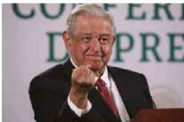
Andres Manuel López Obrador