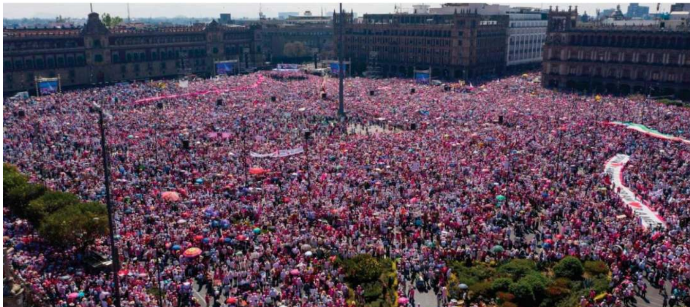
Miles de ciudadanos ocuparon el Zócalo y sus alrededores el 26 de febrero de 2023, en una segunda marcha contra el "plan B" electoral del presidente Andrés Manuel López Obrador.