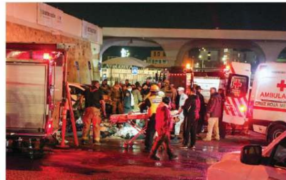
EQUIPOS de rescate durante el incendio en el centro de detención de Ciudad Juárez, el pasado 27 de marzo.

Por ciento de los encuestados atribuye la culpa a los migrantes