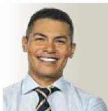
POR CALLO DE HACHA @CALLODEHACHA