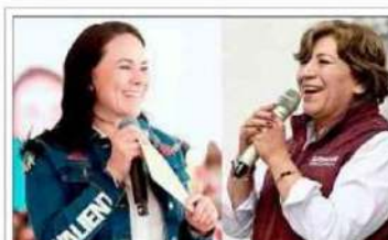
Delfina Gómez y Alejandra del Moral, primera prueba previo de la elección presidencial de 2024

Nuevo inquilino Oaxaca: En San Pedro, acompañado del gobernador Salomón Jara ; del director del Instituto Nacional de los Pueblos Indígenas, Adelfo Regino Montes ; del secretario de Infraestructura, Comunicaciones y Transportes (SICT), Jorge Nuño , y del presidente municipal de San Pedro Coxcaltepec Cántaros, Eleazar García , desde esa región, López Obrador remarcó que la transformación no es obra de un solo hombre, sino de todo el pueblo, mujeres y hombres que han luchado por años por un cambio. Destacó el trabajo,