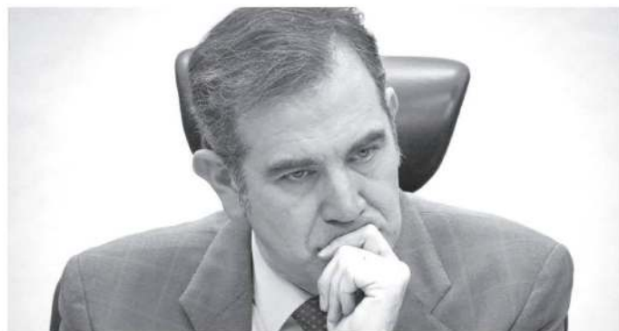
· Imposibilitado por años como consejero en el INE

Para ser elegible debe estar no más de seis años fuera de la UNAM