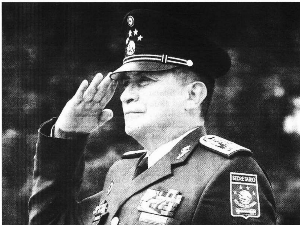
Exhiben los viajes de lujo del general Cresencio Sandoval González, titular de Sedena.

*Conductor del programa Va en serio, Mexiquense TV Canal 34.2, IZZI Canal 135 y Mexiquense Radio