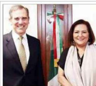
Guadalupe Taddei Zavala, una gran diferencia con su antecesor, Lorenzo Córdova Vianello

Otro INE: La presidenta del Consejo General del Instituto Nacional Electoral (INE) , Guadalupe Taddei Zavala , está marcando una gran diferencia con su antecesor, Lorenzo Córdova Vianello , pues en tan solo dos semanas le ha devuelto al INE el verdadero carácter de un árbitro electoral independiente y mantiene su distancia con el gobierno de López Obrador , con el Tribunal Electoral del Poder Judicial de la Federación (TEPJF) y con los partidos políticos . Va quedando atrás la historia negra con que la que ensuciaron al INE Lorenzo Córdova , Ciro Murayama y Edmundo Jacobo Molina .