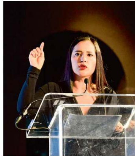
VOCERA. La alcaldesa electa de Cuauhtémoc, Sandra Cuevas.