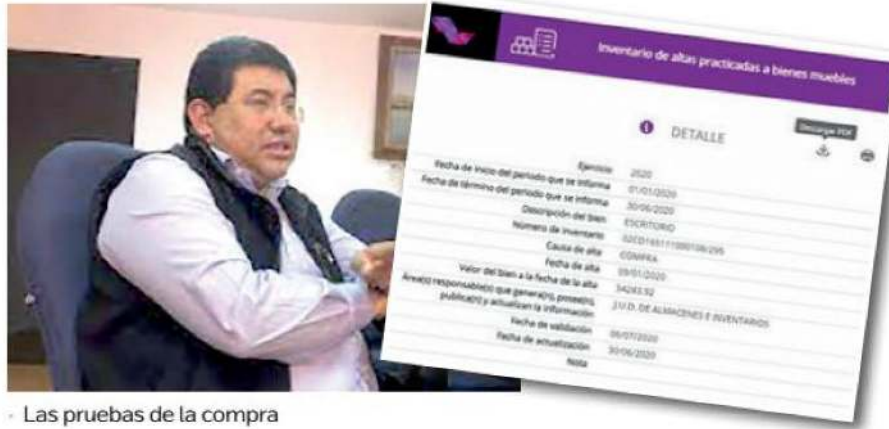
Las pruebas de la compra

mil 240 pesos, cuesta un escritorio de estilo victoriano modelo Everton