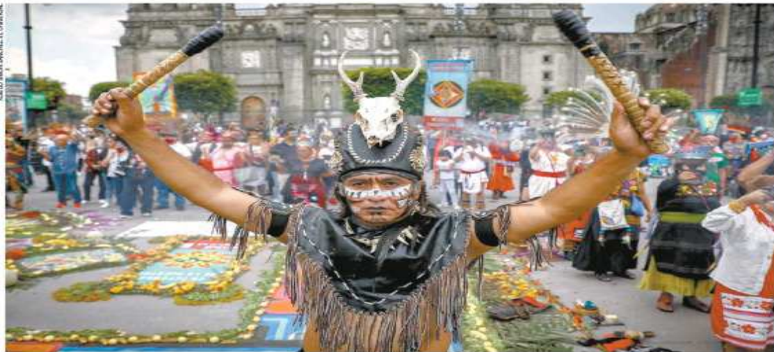
Danzantes de comunidades indígenas de todo el país se dieron cita en el Zócalo capitalino para conmemorar los 500 años de la defensa de Tenochtitlán y se manifestaron contra las actividades del gobierno por no tomarlos en cuenta.