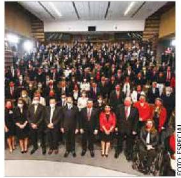
A la LXV Legislatura llegan 35 mujeres y 36 hombres priistas.