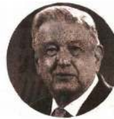
ANDRÉS MANUEL LÓPEZ OBRADOR Presidente de México

"Tienen derecho de quejarse, a asistir a cualquier organismo internacional. Si la OEA lo decide, que vengan, no hay nada que ocultar"