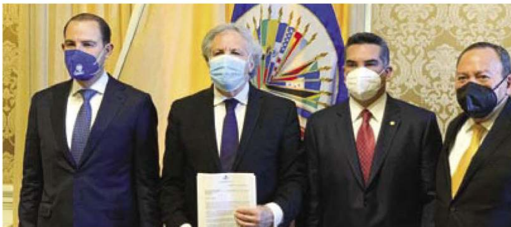
Marko Cortés, Luis Almagro, Alejandro Moreno y Jesús Zambrano.