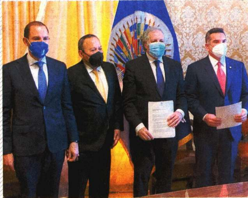
Marko Cortés (PAN), Jesús Zambrano (PRD), Luis Almagro (secretario General de la OEA) y Alejandro Moreno (PRI), ayer en la oficina del organismo en Estados Unidos.

"[A AMLO] le es muy incómodo que estemos en organismos como la OEA"