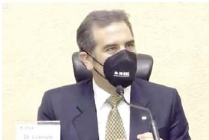
Lorenzo Córdova. Ir contra la representación proporcional es ir contra el pluralismo.