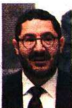
Martí Batres Guadarrama