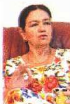
Dulce María Sauri

:::: En una última petición como presidenta de la Cámara de Diputados, la priista Dulce María Sauri , quien hoy entregará la oficina de la Mesa Directiva a Sergio Gutiérrez Luna , hizo un llamado a la equidad. Doña Dulce pidió que en la 65 Legislatura las diputadas tengan las presidencias de al menos la mitad de las 46 comisiones. Recordó que en la actual las diputadas encabezaron 21 comisiones como Puntos Constitucionales, Gobernación, Hacienda,