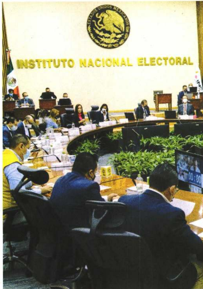
El Instituto Nacional Electoral estableció las millonarias sanciones económicas a los partidos políticos nacionales.