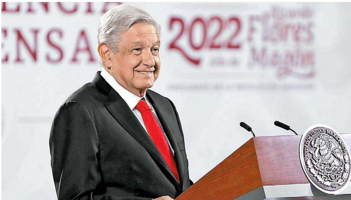
El presidente Andrés Manuel López Obrador en la conferencia mañanera. ESPECIAL

“Los procesos tienen un curso, no podemos pedirle al fiscal que no actúe”