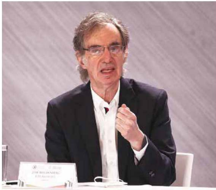
ANÁLISIS. José Woldenberg, expresidente del IFE, ayer, en San Lázaro.