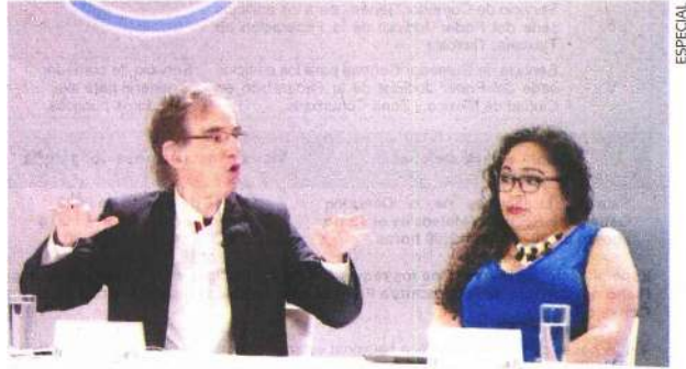
José Woldenberg consideró que el país necesita un órgano electoral independiente, que asegure imparcialidad.