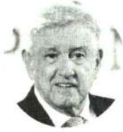
ANDRÉS MANUEL LÓPEZ OBRADOR Presidente de México

"Estamos planteando una reforma para que Marina y Ejército continúen en labores de seguridad pública [después de 2024]"