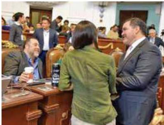
LABOR. Diputados analizan el dictamen.