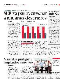
Gráfico: Daniel Rey