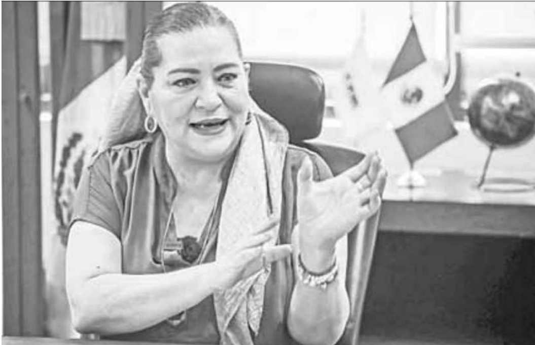
▲ La consejera presidenta subraya que a un mes de que comience, el proceso electoral 2023-2024 "jamás se pondrá en riesgo".