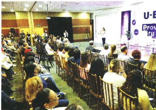
■ La aspirante presidencial morenista sostuvo un encuentro con estudiantes en la Universidad Regiomontana.