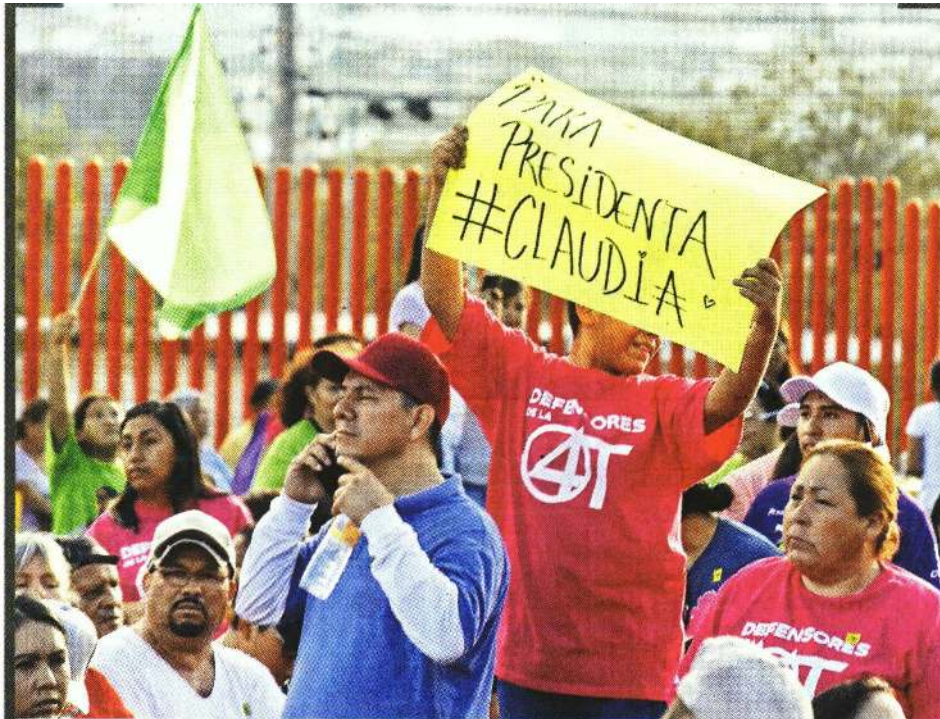
■ En los mítines de Sheinbaum es común que la reciban con el grito de "¡Presidenta! ¡Presidenta!".