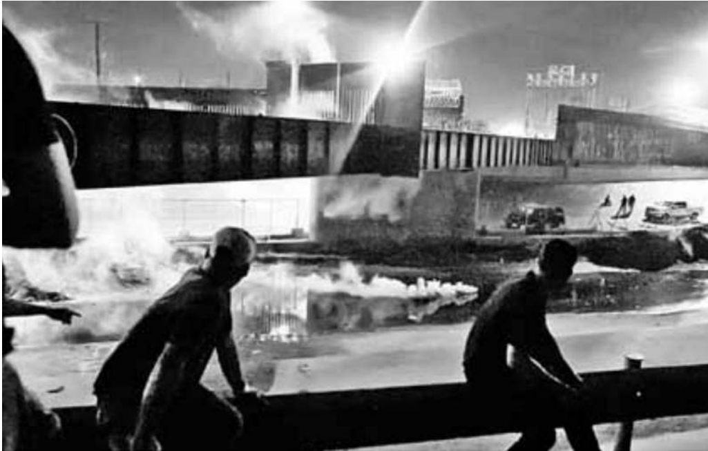
▲ Agentes fronterizos usaron gas lacrimógeno para dispersar a los indocumentados en el paso de Puente Negro, Chihuahua.