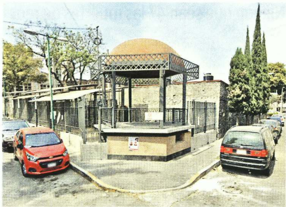
2023. La Alcaldía colocó una reja perimetral que impide el paso por completo. Además de un techo que no es lo que se había proyectado con recursos del Participativo.