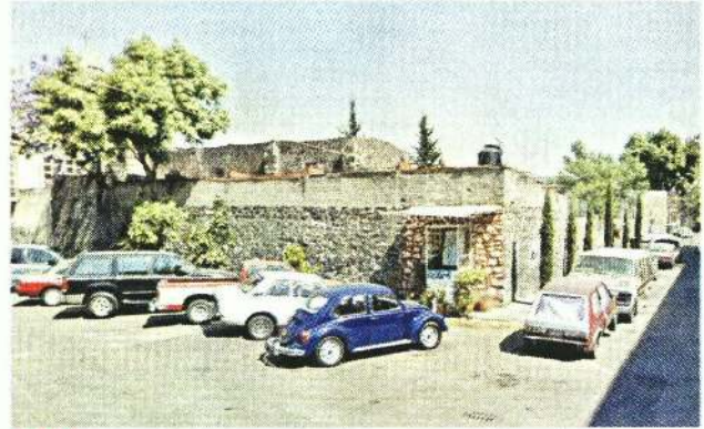
2011. El lugar era aprovechado como estacionamiento y, también como tiradero clandestino de basura.

“ Poco a poco empezamos a ver una serie de intenciones de cerrar el espacio e impedir que pudiéramos acceder a él. Nos decían que teníamos que pedir permiso a la Alcaldía”.