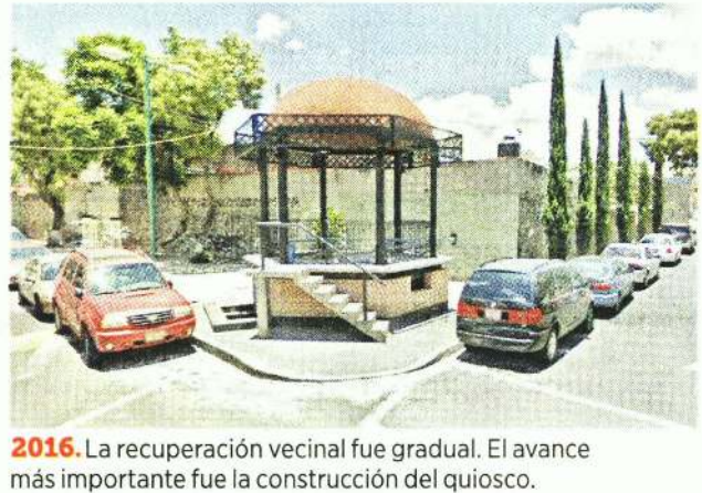
2016. La recuperación vecinal fue gradual. El avance más importante fue la construcción del quiosco.