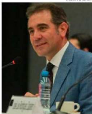
Lorenzo Córdova en la FIL.