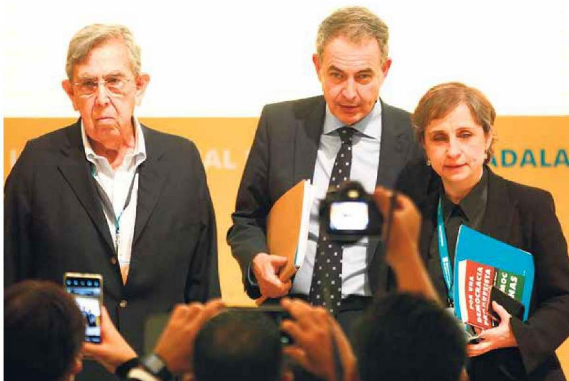
DIÁLOGO. Cuauhtémoc Cárdenas, José Luis Rodríguez Zapatero y Carmen Aristegui, ayer, en la FIL de Guadalajara.