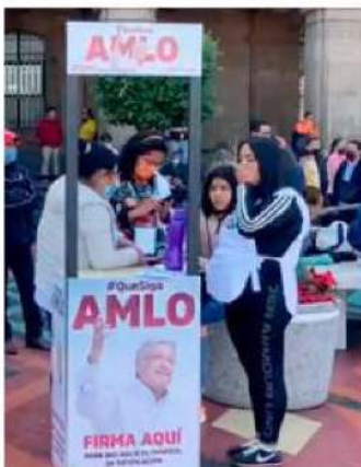
Y de dónde sale el recurso...