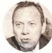
JESÚS ZAMBRANO Presidente del PRD

“Nosotros sí mantenemos nuestra confianza con el fiscal. Creemos que lo que luego se empieza a manejar en la opinión pública, pues tiene que mantener la reserva hasta que haya otro tipo de situaciones, hasta que haya determinación de las autoridades”, declaró. ●