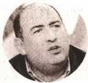
RUBÉN MOREIRA Líder de diputados del PRI

"Para mantener la honorabilidad, la legitimidad y la credibilidad, [Gertz] debe dar respuesta en sede parlamentaria a estos señalamientos"