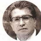
RICARDO MONREAL Líder de senadores de Morena

“[El caso Gertz] viene a demostrar que la lucha contra la corrupción, la bandera insignia de este gobierno, está desnudándose como una verdadera farsa”