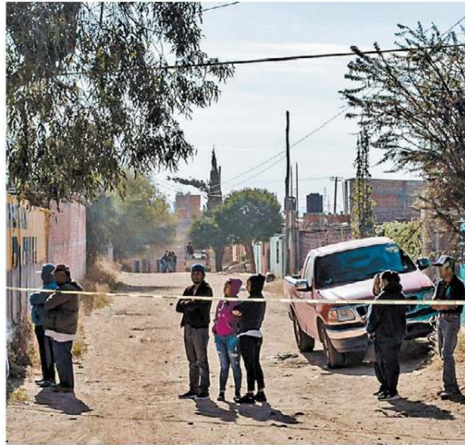
Múltiple asesinato en tierras zacatecanas.

Al otro lado de la moneda están Campeche y Baja California Sur, donde las muertes violentas muestran reducciones importantes de 85 y 94 por ciento cada una. En la entidad de la Península de Yucatán suman cuatro asesinatos y en BCS solo uno. ■