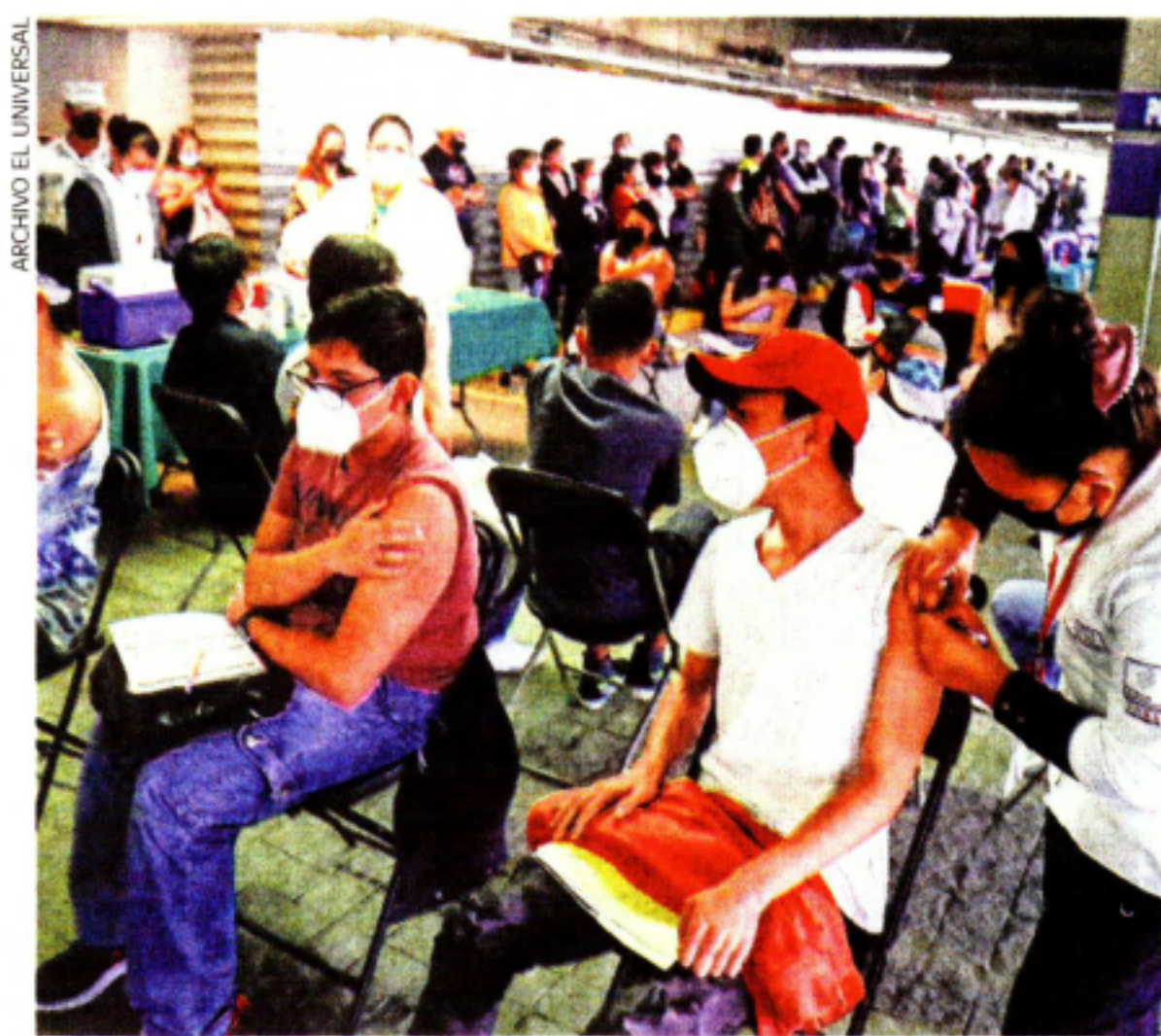
La ADIP destacó que las personas continúan acudiendo a la vacunación contra Covid-19 y mantienen el uso del cubrebocas.

40% REDUCCIÓN de los ingresos hospitalarios, al pasar de 50 a 30 a la semana, de acuerdo con cifras de la ADIP.