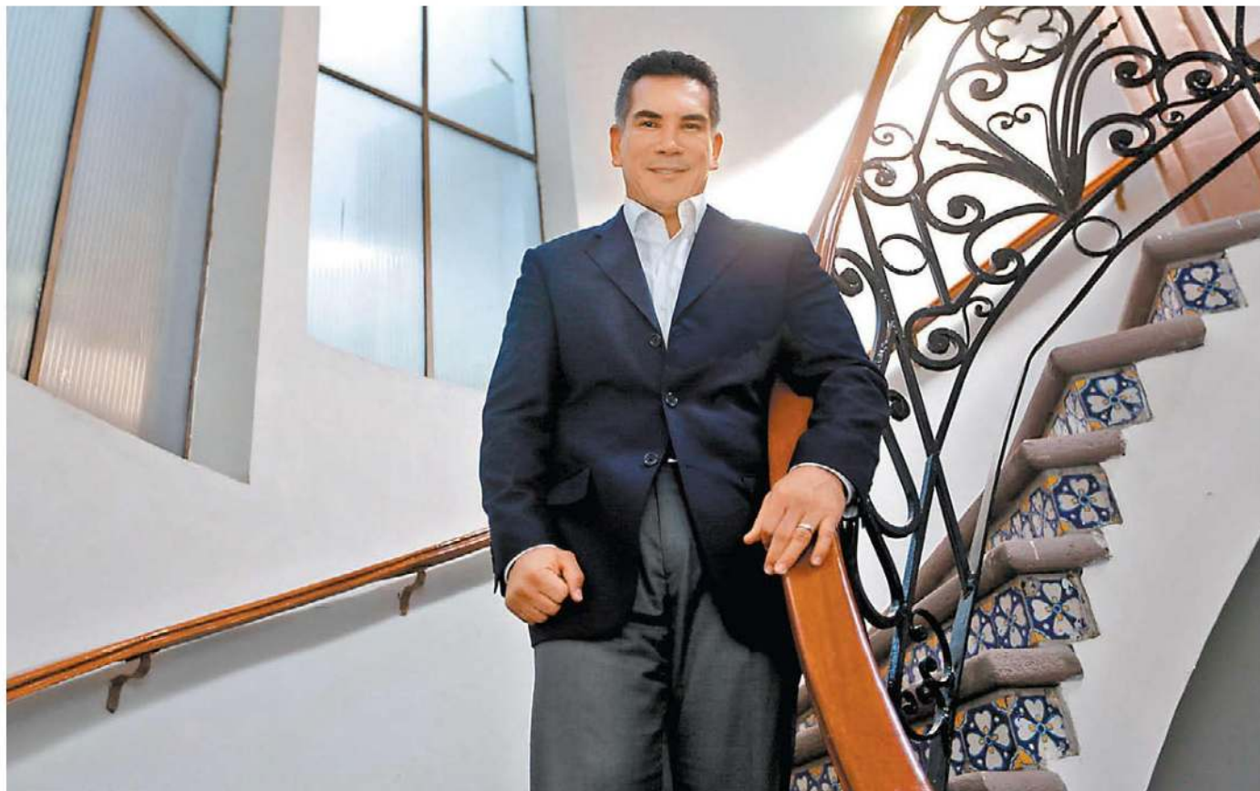
La alianza Va por México está firme, asegura el dirigente del Revolucionario Institucional. ARACELI LÓPEZ