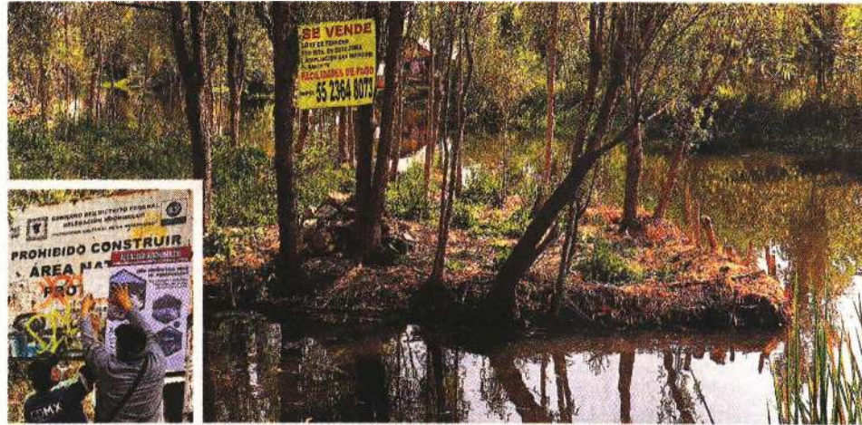
■ Autoridades capitales advierten sobre los riesgos de adquirir terrenos en áreas protegidas.