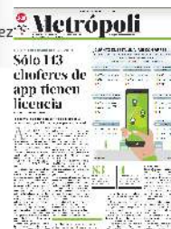
Gráfico: Rodolfo Gómez