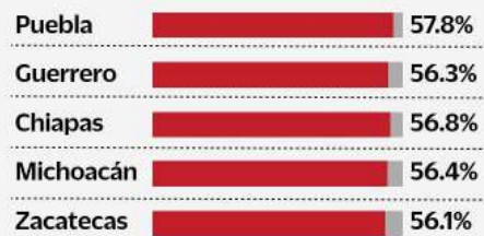
GRÁFICO: XAVIER RODRIGUEZ