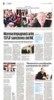
Lorenzo Córdova, titular del INE, dice que el modelo electoral es un referente a nivel mundial.