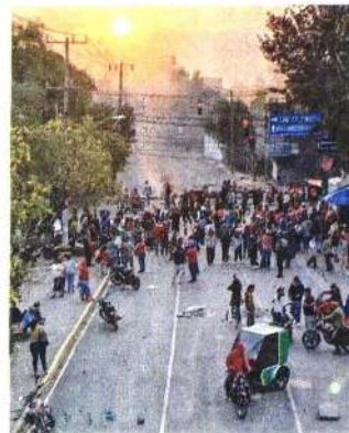
Habitantes de San Gregorio se enfrentaron a policías y la GN.

"Informamos que se están haciendo obras de drenaje que habitantes de la zona han solicitado por salubridad y medio ambiente"